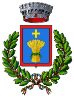
Comune di Cossioine