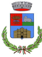
Comune di Mara